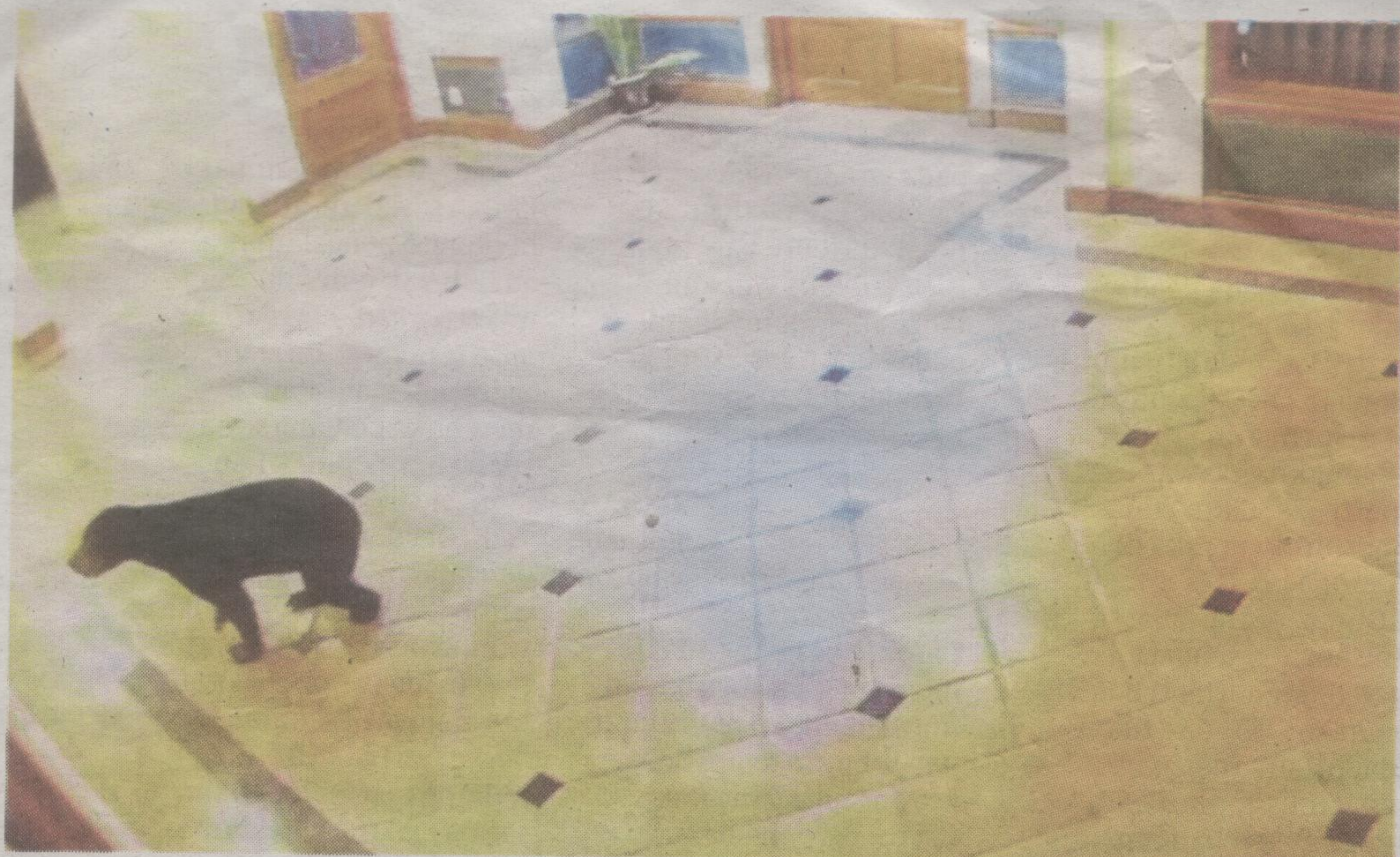
SEEKOR beruang matahari mencero boh sebuah resort di Teruntum dirakam kamera litar tertutup.